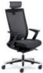
Drehstuhl Netzrücken cpn89 mit Nackenstütze, Z-Armlehnen, Alu-Fußkreuz poliert.