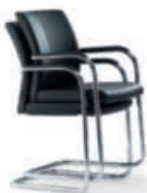
Konferenz-Freischwinger cca58 Gestell verchromt, auch stapelbar.