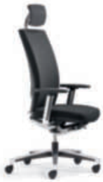
Drehstuhl Polsterrücken cpl99 mit Nackenstütze, 4F-Armsupports, Alu-Fußkreuz poliert.