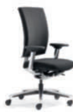
Drehstuhl XS-XL (NPR) Polsterrücken cpl67 mit MF-Armsupports, Alu-Fußkreuz poliert.