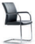
Konferenz-Freischwinger cca58 hoher durchgehender Rücken, Gestell verchromt.