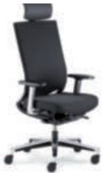
Drehstuhl Netzrücken mit Polsterauflage cpn99 mit Nackenstütze, 4F-Armsupports, Alu-Fußkreuz poliert.