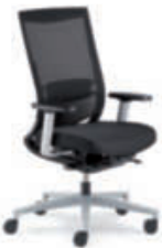
Drehstuhl Netzrücken cpn88 4F-Armsupports, Alu-Fußkreuz alu-farbig.