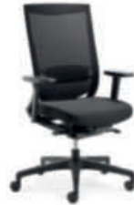
Drehstuhl Netzrücken cpn88 Höhenverstellbare Armlehne, Kunststoff-Fußkreuz L.