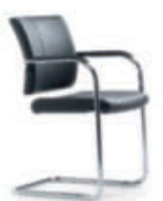
Konferenz-Freischwinger cca56 geteilte Rückenlehne, Gestell verchromt, auch stapelbar.