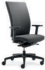
Drehstuhl Polsterrücken cpl98 3D-Armsupports, Kunststoff-Fußkreuz L.