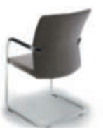
Konferenz-Freischwinger cca58 hoher durchgehender Rücken, Gestell alu-farbig.