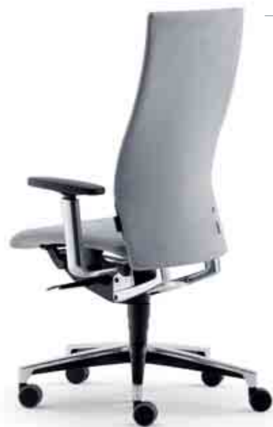
Klöber Cielo cie98 Bureaufauteuil met synchroonmechaniek en 4F-armsupports. Klöber Cielo cie98. Fauteuil synchrone avec accoudoirs 4F.

Zo eenvoudig in te stellen als de gesp van een riem: het gemakkelijk te verstellen mechaniek van de Cielo. Aussi facile à régler qu'une boucle de ceinture: le réglage rapide du fauteuil Cielo.